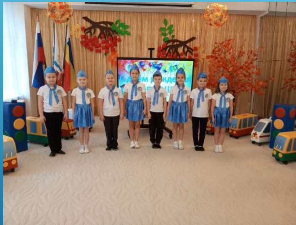
Команда ЮПИД в 2024-2025гг