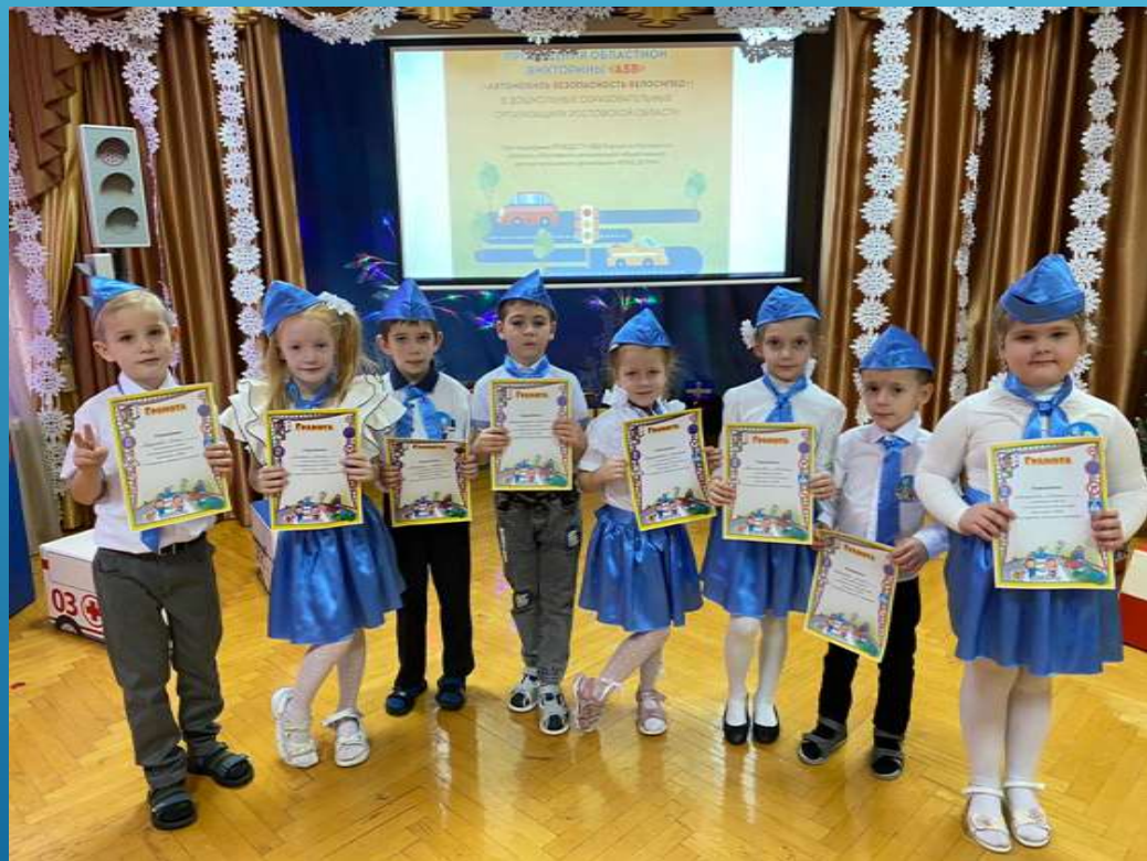
Команда ЮПИД в 2023-2024гг

1 сентября 2014года - день рождения нашей команды.